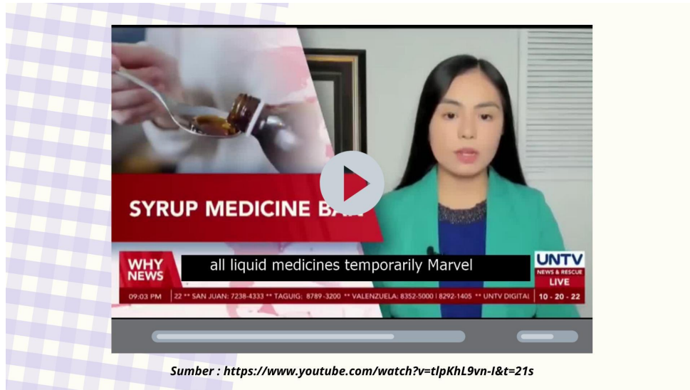
Sumber : https://www.youtube.com/watch?v=t1pKhL9vn-I&t=21s